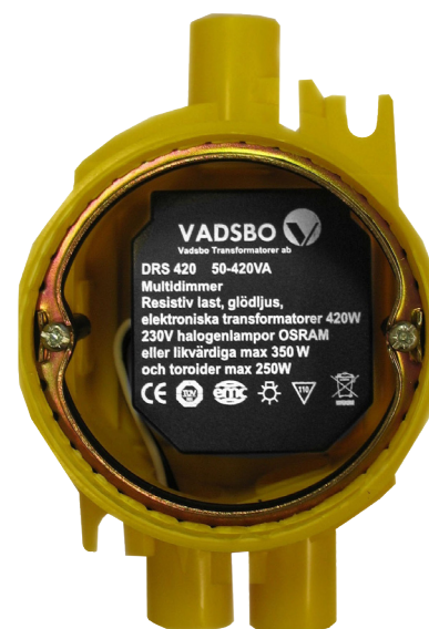
DRS 420W 19 023 09 13 774 43