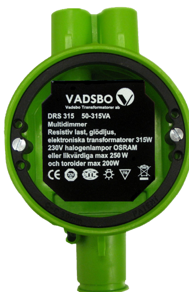
DRS 315W 19 022 63 13 774 42