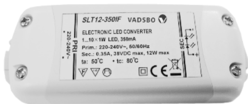
LED-driftsdon 10W 350mA eller 700mA - E 79 841 73 - E 79 841 74

Elektroniska LED-driftsdon med konstant-ström 350 och 700. 220-240Vac primärt. Kortslutnings-, överbelastnings och överhettningsskydd.