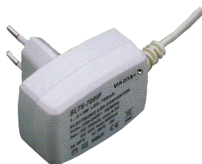
Alldriftssdon 6W, 700mA, 12Vdc 6W, 350mA, 24Vdc